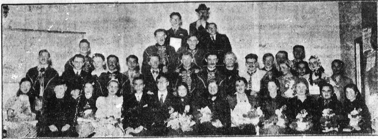
A ref. gimnázium Kölcsey előadásának szereplői

— Jó állást akar? Tanuljon gyorsírást és gépirást. A perfekt gyorsíró és gépiró könnyebben talál elhelyezkedést és nagyobb igényekkel léphet fel a munkaadókkal szemben. A Naményi Gyorsíróiskolában végeztek a következő munkaterületeken helyezkedtek el: minisztériumok, Magyar Nemzeti Bank és egyéb pénzügyintézetek, vármegyék és városi hivatalok, kereskedelmi és ügyvédi irodák. Új tanfolyam február elején kezdődik. — Tanfolyam után államvizsga, állami állásokra is képesítő bizonyítvány. Vidékről bejáróknak 85 százalékos vasúti tanulólétszám. (Rákóczi-utca 17. sz.)