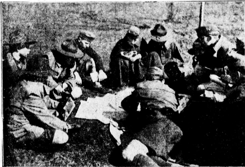
Országos őrvezetői táborozás a Cserkészparkban. Képeink a térkép-tanulmányozás pillanatát örökíti meg

küzdése után éjjel tájban értek be az őrök a tábor területére és tértek nyugovóra.