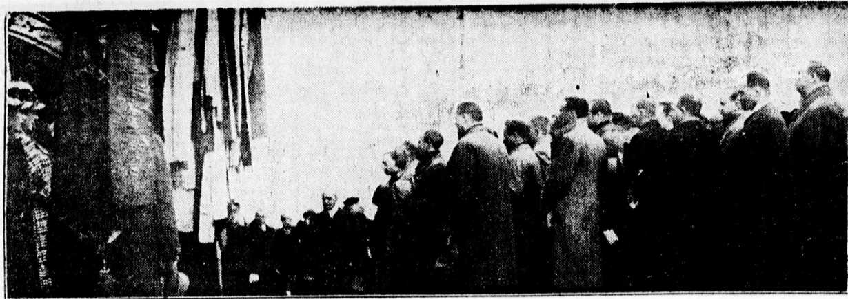
Finn dalosok fogadtatása a pályaudvaron