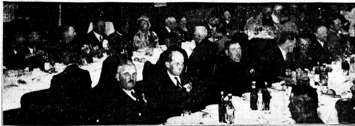
A Vitézi Szék diszcedje az Arany Bika üvegtermében

A vitézi Aldomás után a debreceni Nemzetes Asszonyok a Vitézi Székházban látták vendégül a vonat indulásáig a vidékről érkezett Nemzetes asszonyokat és vitézeket.