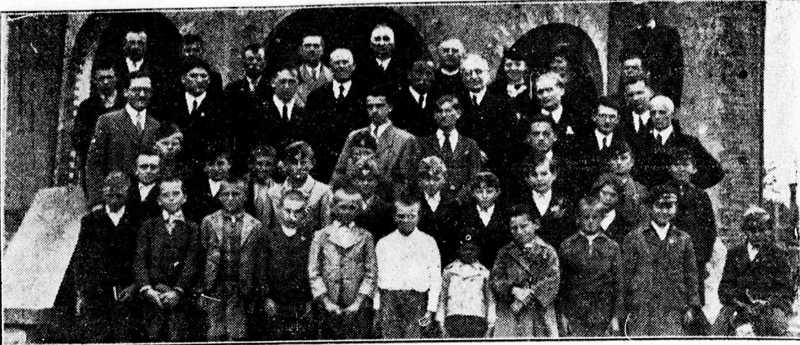
A Soli Deo Gloria Diákszövetség és a csapókerthi Ref. Ker. H. J. Egy. Ref. H. J. mozgalmi napja a csapókerthi gyülekezetben

40.000 pengőt nyert: 10237 10.000 pengőt nyert: 25939 5.000 pengőt nyert: 67268 3.000 pengőt nyert: 35513 2.000 pengőt nyert: 39547 1.000 pengőt nyert: 7807 500 pengőt nyert: 16633 19239 22806 49994 61635 62187 62730 66572 86285 86765 300 pengőt nyert: 2978 11136 11221 24581 26165 43808 57404 59485 59719 66149 68709 71655 83585