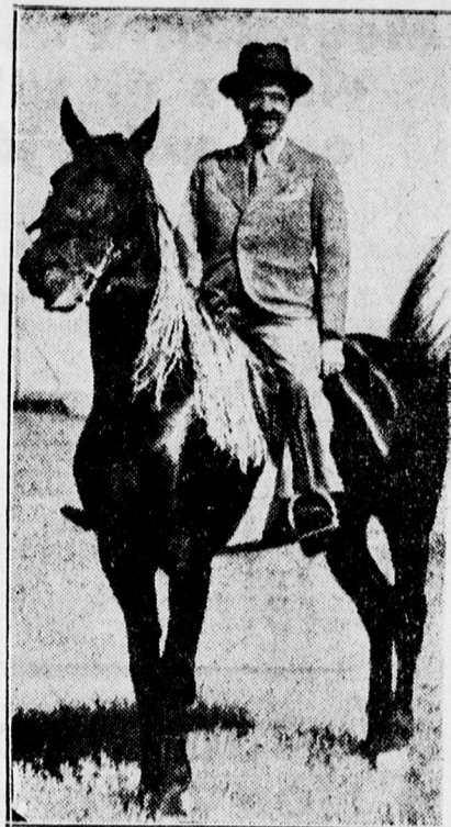
Csöky István külügyminiszter egy csikós lován lovagol

Erdelődünk a délutáni órákban a csapatkórháznál is, ahonnan azt a felvilágosítást kaptuk, hogy a két súlyos sebesült állapotában is lényeges javulás állott be és nem kell tartani a gonoszulástól sem.