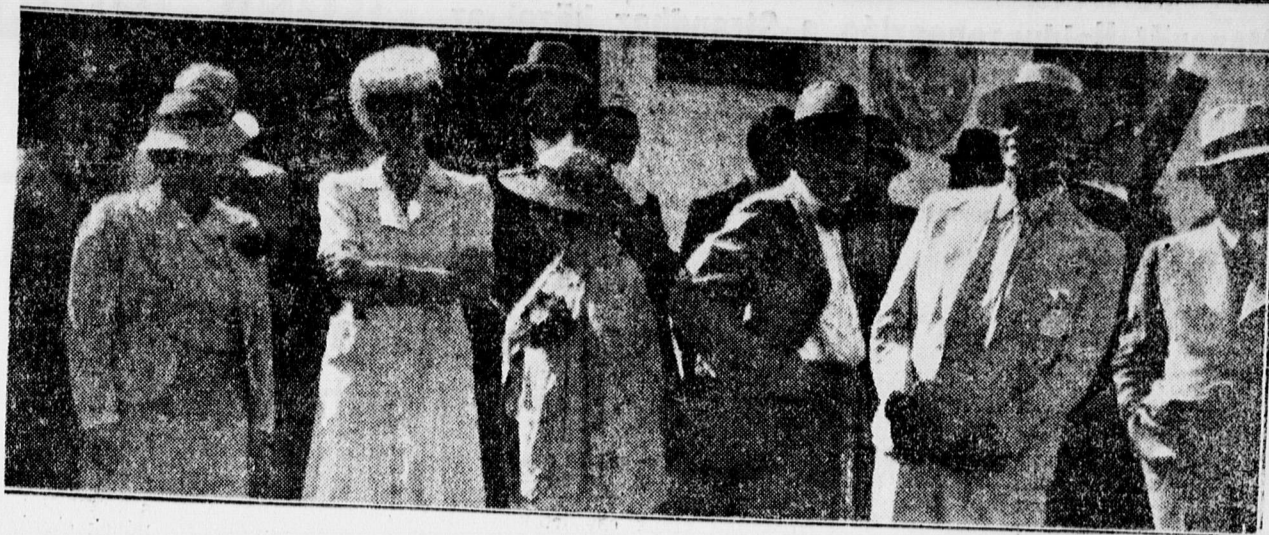
Keresztes-Fischerné, Friczné, Lossonezy Istvánné, Keresztes-Fischer és Fricz miniszterek a Hortobágyon

Ezek a magyarországi napok, amelyeknek a pompás időjárás kedvezett, feledtetlenül kedves emlékezetünkben maradnak meg. A sok személyes összeköttetés, melyet itt teremtettünk, vagy felújítottunk, minden biznnyal hozzá fog járulni azoknak a köteleknek a megerősítéséhez és megszilárdításához, amelyek a történelem, a közös sors, a közös érdekek s mindenekelött a kölcsönös rokonszenv teremtetlek közöttünk.