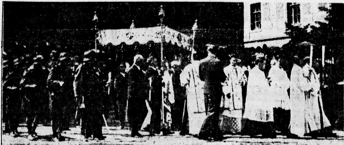
Urnapi körmenet Debreczenben

testáns Világ szövetség Heinmenben (Hollandiában) tartott konferenciáján. A német, francia, svéd, norvég,