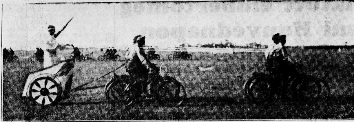
A Honvéd-nap egyik hatásos produkciója