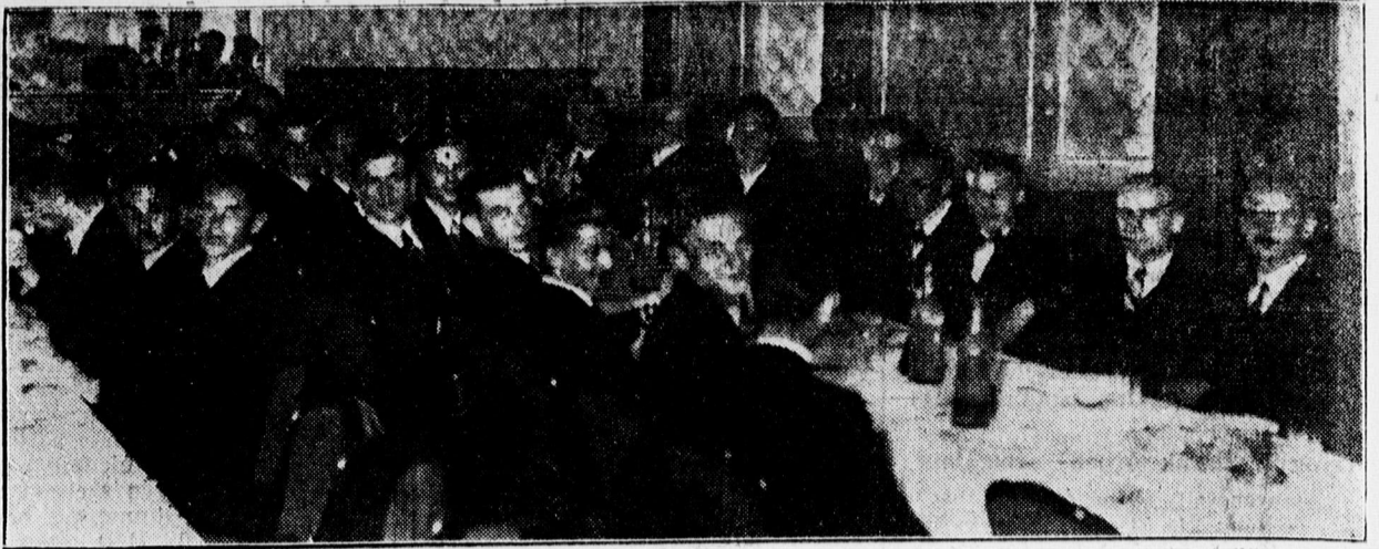
Piarista diákok érettségi bankettje az Angolban

Erdekes közgazdasági tárgyú előadás. A gazdasági kérdések iránt érdeklődők nagy érdeklődéssel fognak tekinteni Sáfrán Ferenc MÁV. műszaki főtanácsos előadására. — Sáfrán Ferenc, az északi főműhely vezetője nagy felkészültséggel és hozzáértéssel foglalkozik gazdasági kérdéseink tudományos taglalásával. A Magyar Mérnök és Építész Egylet debreceni osztályának rendezésében június hó 16-án (pénteken) este fél 7 órakor a Kereskedő társulat dísztermében (Feren József-út 8. I. emelet) „A magyarság a gazdasági világválságban” címmel tartandó előadásában Sáfrán ismeretnői fogja a szovjet, a nemzeti szocializmus és a fasizmus gazdasági berendezkedését és a magyar gazdasági élet kérdéseit a gazdasági válságban. Az előadó e tárgyról a Mérnök Egylet közgazdasági és szociálpolitikai osztályában Budapesten ez év tavaszán már tartott nagy sikerrel és általános elismerés mellett előadást. Az előadásra belépődíj nincsen és azon minden érdeklődőt azívesen lát a Mérnök Egylet elnöksége.