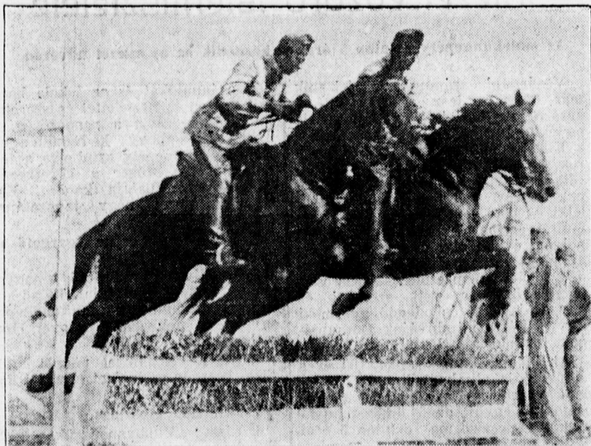
Szép lovasjelenet a Honvéd-napon

A rendezésnek zökkenésmentes és minden díszetlet megérdemlő lebonyolítása nagy feladatot rótt a város vezetésére, mert hiszen több mint 350 és nem csekély számú polgári személy elhelyezéséről és mellesleg szórakoztatásáról kellett gondoskodni. Hajdúszoboszló város tűzoltósága, valamint a város hivatalos vezetősége dr. Márton Gábor polgármester vezetésével ennek becsülettel meg is felelt.