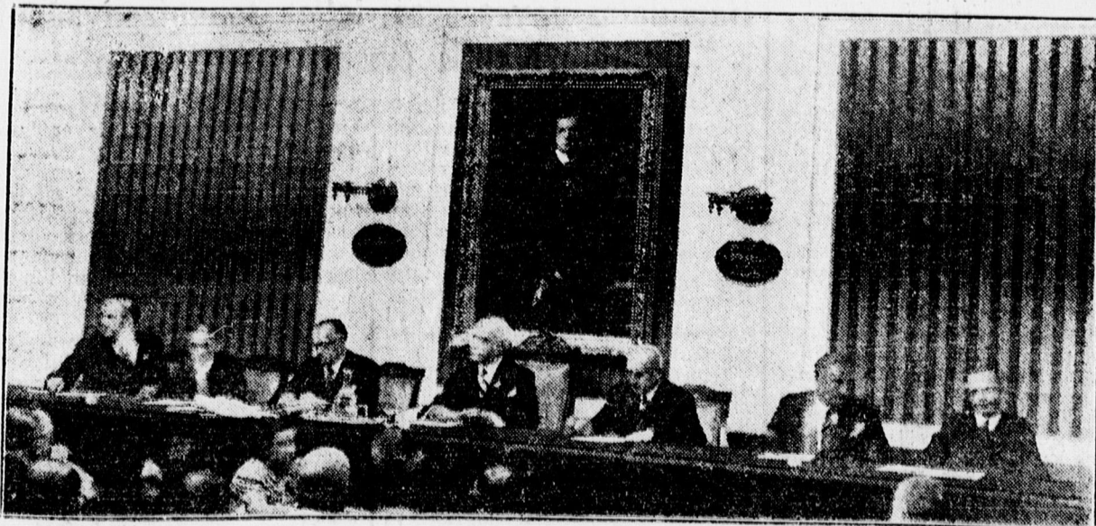
A Kereskedelmi és Iparkamara ünnepélyes közgyűlés keretében leplezte le a Kormányzó arcképét

— Kárpátalja 2.000 méterig feltornyosuló hegysorainak hatalmas erdőségei, fenyvesekkel borított hegyoldalai és azok ózondús és balzsamos levegője nagyszerű újra erősítője lesz a magyar egészségnek és az egész hegyvidék pompás edzőhelye a magyar erőnek. Lehetetlen ezt szavakba önteni és soha egyetlen magyar ember nem felejtí el azokat a magasztos érzéseket, amelyeket a felejtethet-