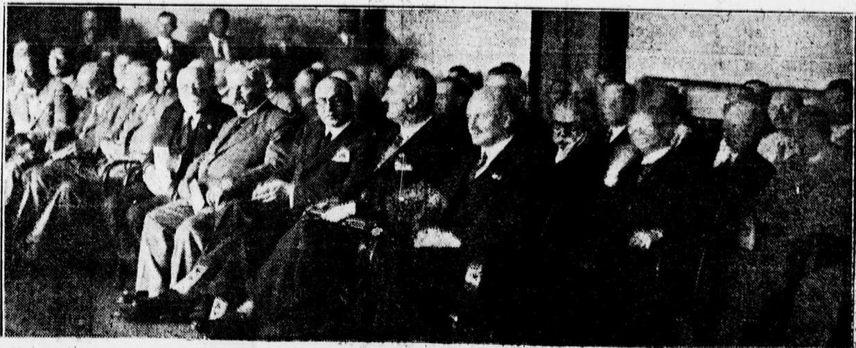
Az Erdészeti Egyesület közgyűlésén a hallgatóság egy része

Ezután az okszerü erdőgazdálkodás szükségességét hangoztatta az