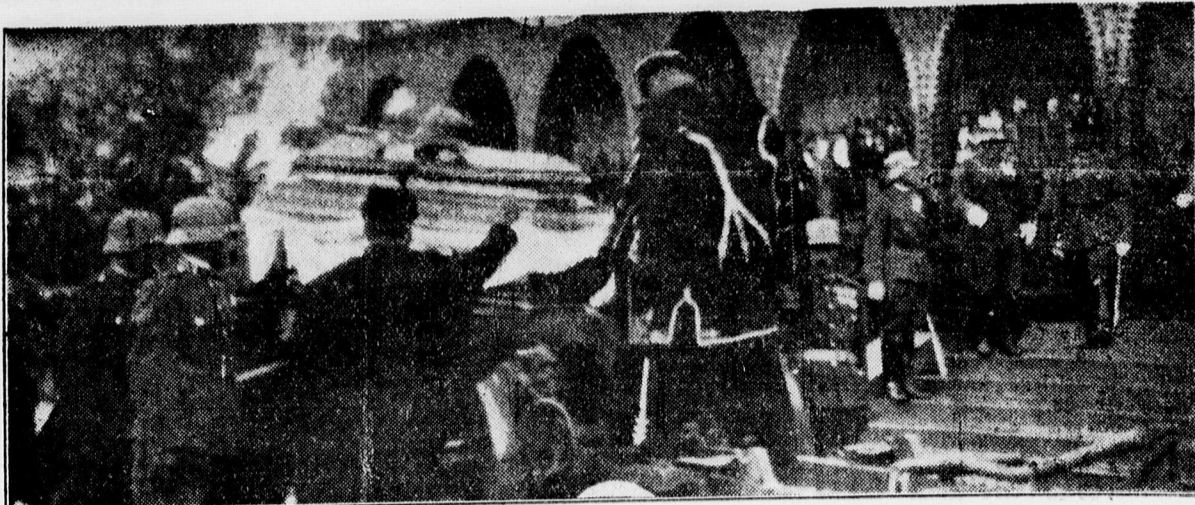
eberswaldi Slegler Géza altábornagy koporsóját az ágy utalpra helyezték

Ingyenes nagy légtalmi előadás a nők részére a Városháza dísztermében június 22.-én, csütörtökön délután 5 órakor. A Női Csoport-elnöksége kéri a város asszonyait, hajdonait, hogy az előadásban minál nagyobb számban megjelenjenek szíveskedjenek. Előadást tart Ollinger Béláné született Csanak Margit budapesti lakos a Légtalmi Liga Országos Női Bizottsága titkára. A Légtalmi Liga női csoportja elhatározta a szegényeknek gázalarcval való ellátását s ennek megszervezése és végrehajtása céljából egy bizottság alakul.