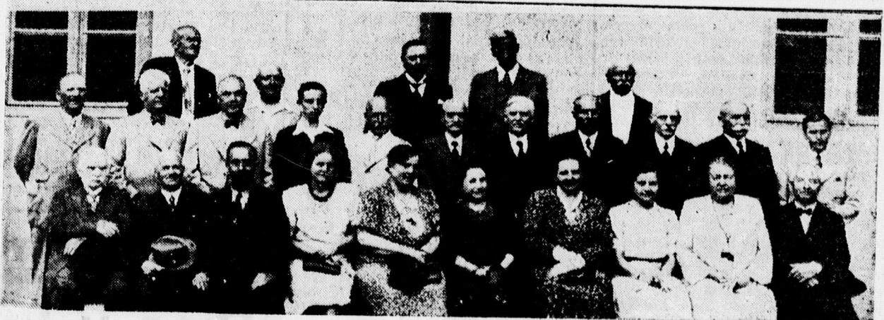
10 éves érettségi találkozók a Kollégiumban