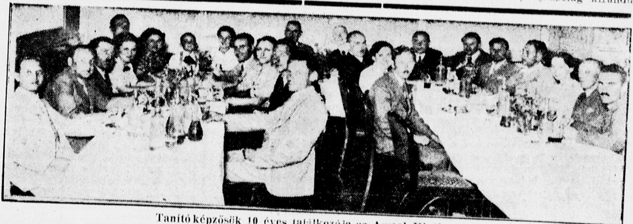
Tanítóképzősök 10 éves találkozója az Angol Királynőben

A miniszterelnök ezután bejelentette, hogy VI. György király a kö-