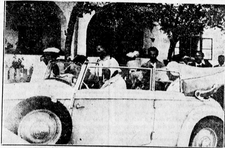
József főherceg a hortobágyi csárda előtt