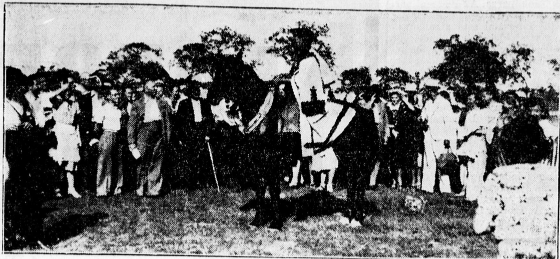
Felvidékiek a Hortobágyon