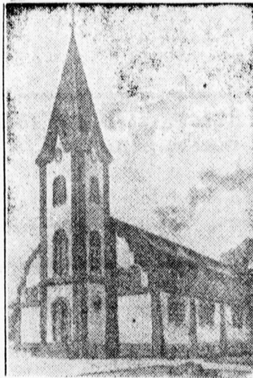
A új nyiradonyi református templom tervrajza

Reméljük, hogy ez a kérelem Debrecenben is visszhangot fog keltetni és a szívekkel együtt a zsebek is ki nyílnak. Nem nagy összegekről van itt szó, csak az a fontos, hogy minél többen adakozzanak. Így lesz a fil-lérből a pengő s pengőből a bankó. Az adományokat a nyiradonyi református templomépítő bizottság címére kell küldeni. Itt említjük meg, hogy a gyűjtést engedélyező belügyminiszteri okirat száma 49.691—1939. A bizottság minden adományt örömmel nyugtázt.