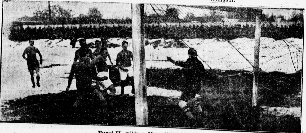
Turali II. gőlle a Hungária hajójához

— A német könyvkiállítás a Déri Múzeumban ma, kedden délelőtt 10—11-ig és délután 4—7-ig utoljára van nyitva. Beléptéje nincs. — Die deutsche Buchausstellung im Déri Museum ist heute Dienstag von 10—11 und 16—19 Uhr zum letzten mal geöffnet.