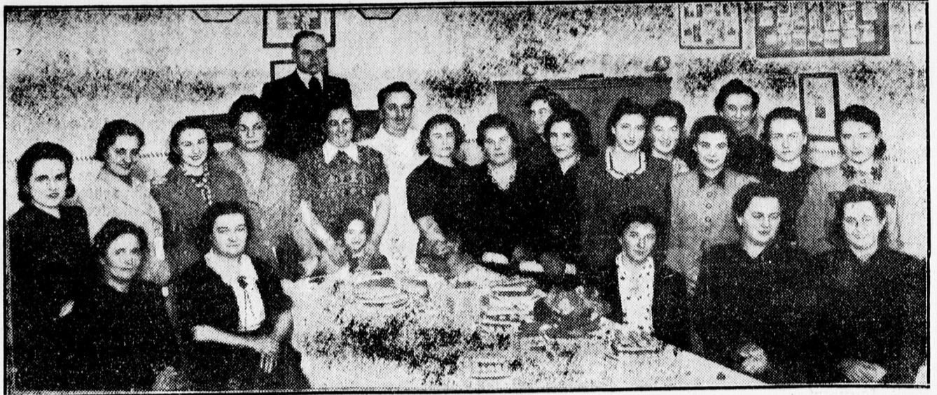
A vendéglős szakiskola által rendezett főzőtanfolyam résztvevő

Gyermeke jövőjét biztosítani akarja az élet minden eshetőségére? Irassa be Naményi Gyorsíró, Gépiró Iskola április elején kezdődő új „Irodai Tanfolyam”-ára s kényeret jelentő tudást, fegyvert ad kezébe. Vidékről bejáróknak 85 százalékos vasútkedvezmény. Államvizsga, államérvényes bizonyítvány. (Rákóczi-u. 17.)