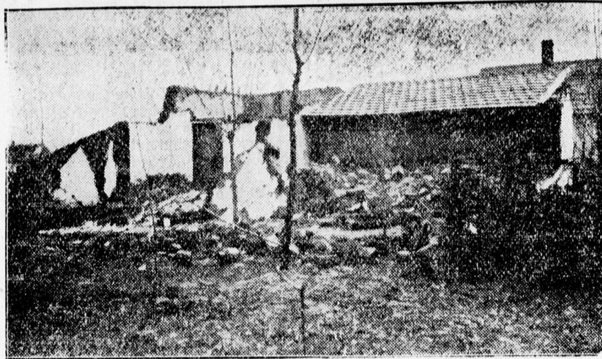
A Téglavetőben beomlott épületek