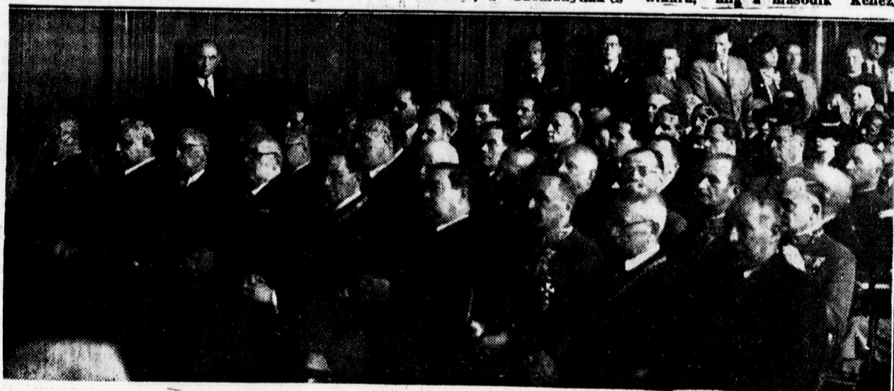
A diszdoktoravató előkelő közönsége és az egyetemek képviselői