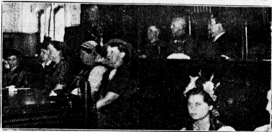
A tűzharcosok ünnepe a vármegyeháza dísztermében

— Magasztos ünnep számomra ez a mai nap, mert itt összegyűltek azok a bajtársaim, akikkel négy és fél éven át