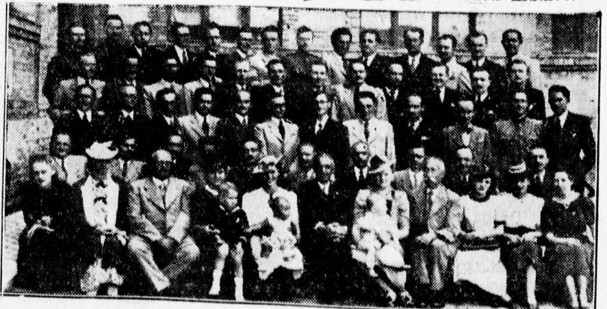
Rek. gimn. 10 éves érettségi találkozója

— Cukorrépatermelésünk fejlesztése érdekében a földművelésügyi minisztériumban tárgyalások folynak, amelynek tárgya a hazai cukorrépatermelés átszervezése. A kormány a Magyar Vidéki Sajtótudósító Budapesti jelentése szerint azzal a tervvel is foglalkozik, hogy a cukorrépatermelésben intenzíven bekapcsolja a kisgazda-társadalom széles rétegeit.