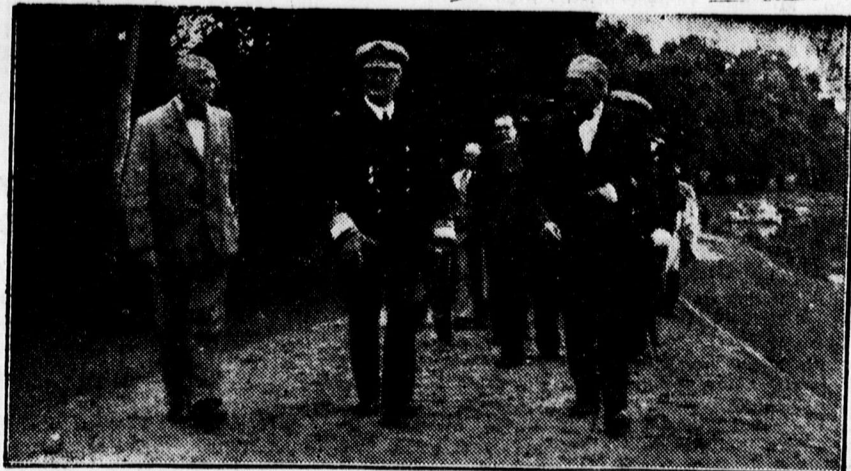
A Kormányzó megérkezik az öntözőmű felavatására

Tizenegy órakor érkezett meg gróf Teleki Pál miniszterelnök és gróf Teleki Mihály földművelésügyi miniszter autón Tiszafüred község határába, ahol az új betoncsatorna hídjánál felállított díszátor előtt Kállay Miklós az Országos Öntözési Hivatal elnöke fogadta a kormány elnökét és társaságát. A miniszterelnök és a földművelésügyi miniszter, valamint az avató ünnepség egész közönsége a betonön-