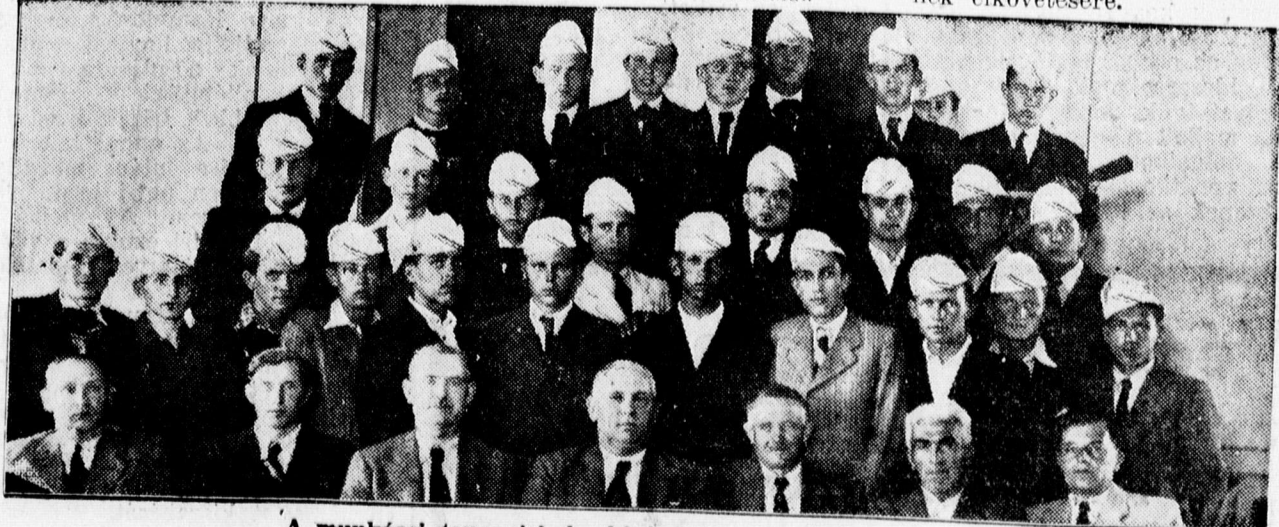
A munkácsi ipariskola kiránduló csoportja Debrecenben