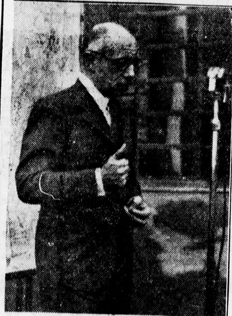
Gróf Teleki Pál miniszterelnök felavató beszédét mondja

ahogy sikerült a világ nagy termelő területein. Az öntözés mindenütt, ahol öntöznek más és más. Mi magára épített csatornába szállítjuk alá a vizet, hogy a párolgás minél kevesebb legyen. A mi öntözésünknek két nehézsége van, mert nálunk a helyzet az, hogy nemcsak a víz odavezetéséről, hanem a tulsok víz