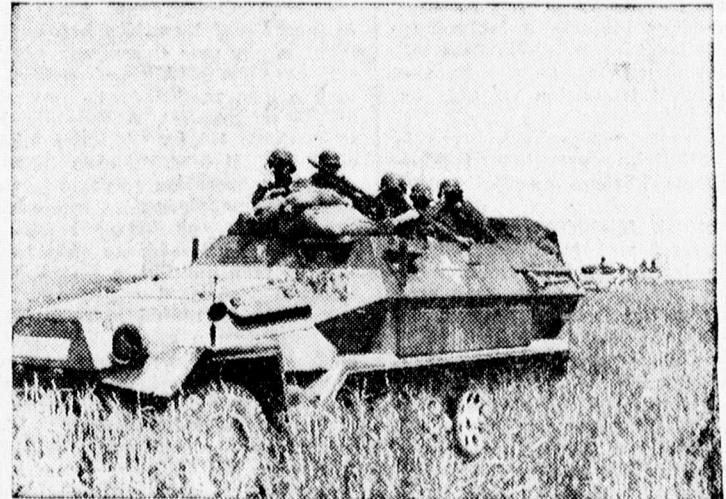
Német pancéllócsók elnyomulása