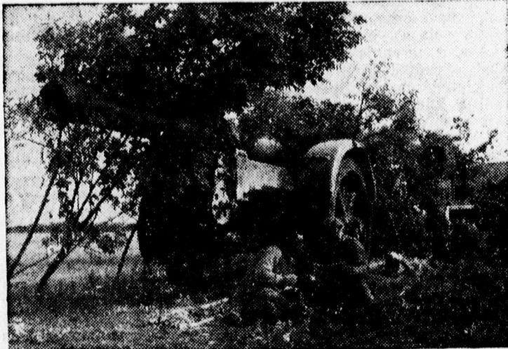
Alkalmazott német ágról

Elkövették az első csalást a cukorjeggyel. A debreceni ügyészség feljelentés nyomán eljárást indított az első debreceni cukorjegy csalás ügyében, amelyet egy magáról megfélemlített közalkalmazott követett el azért, hogy saját nevére két cukorjegyet vátoth és mind a két cukorjegyet igénybe is vette. Az ügyészség lefoglalta a két cukorjegyet és 72 deka kockacukrot, amit a levágott hat szelvény után vásárolt a kettős jegytulajdonos.