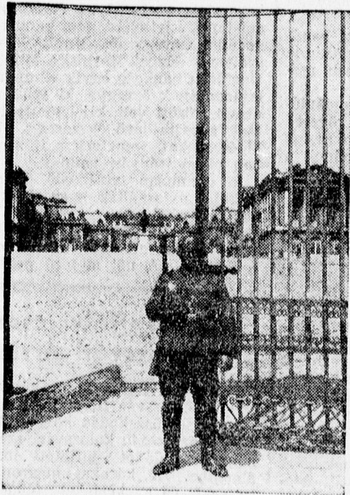
A versaillesi kastély

Nyomatott a Magyar Nemzeti Könyv- és Lapkiadóvállalat Rt. műintézetének körforgó gépén. Igazgató: Somogyi Gábor.