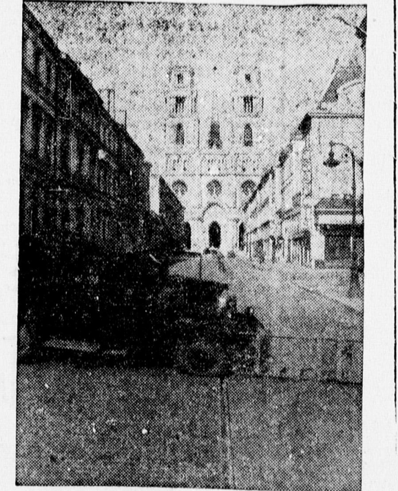
A sértetlen orleansi temető

salakja gyümölcsfáknak mérszegény talajához kiválóan alkalmas. Kapható a Debreceni Műkőgyárnál, Fürdő-utca 2. Telefon 10—96. 17