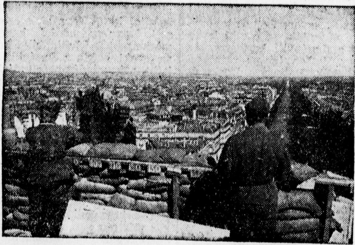
Kilátás az Arc de Triomphe tetejéről

— Hirdetmény. Értesítem a város érdekelteket, hogy folyó évi július hó 27-től, azaz szombatól kezdődően a város területén és határában a gabona és egyéb szemes termények hordása és cséplése megkezdhető és folytatható még vasárnapon is. Polgármester.