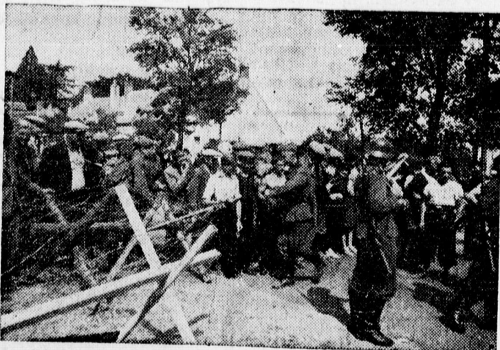
Német katonák őrzik a megszállt határokat

A Testvériség atlétikai viadalán Németh érte el a legjobb eredményt 14.85