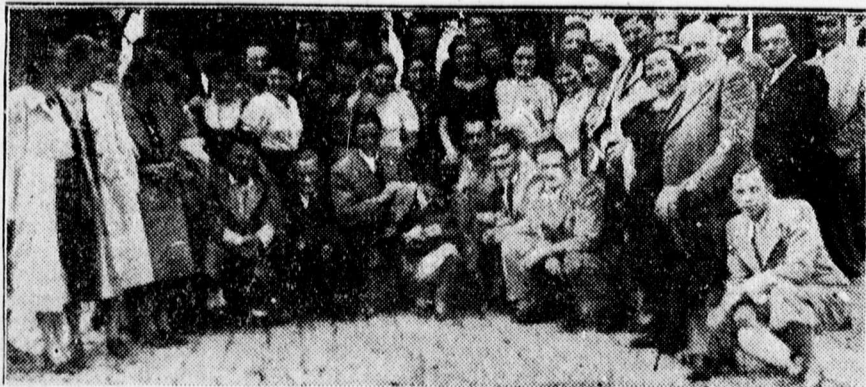
Kárpátaljai tanítónők és tanítók kirándulása a Hortobágyon

— Minden hazafias kereskedőnél kaphat repülőbélyeget.