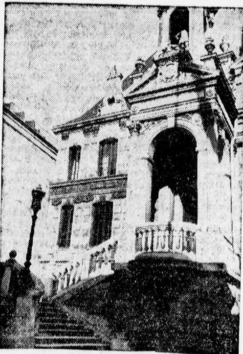
La Rochelle városháza

Újméretű igazolványos képek Berzseki fényképész-mester, fotókereskedőnél, Piac-u. 38. 1225