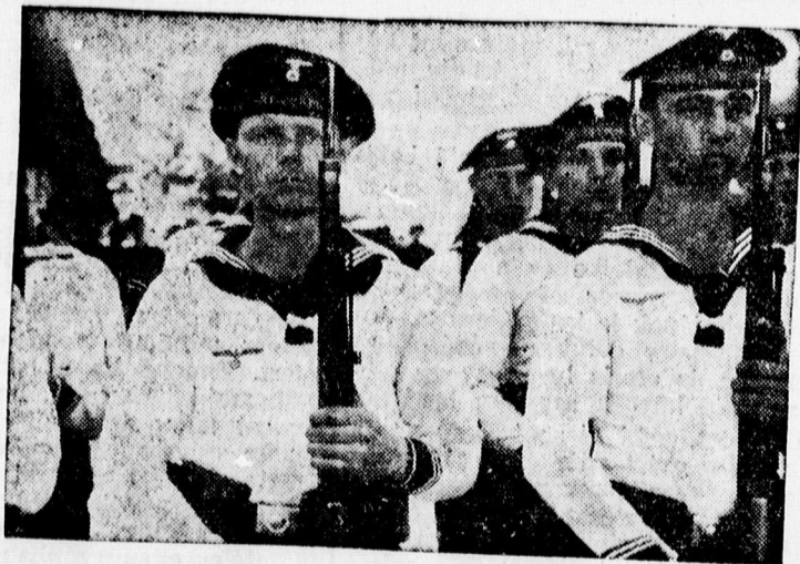
Tisztelgés a nar viki hősök előtt