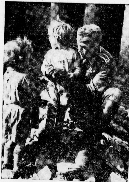
A polgári lakosság szívébe fogadta a német katonákat