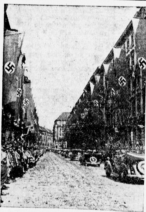
A „Vezér ünnepélyes hazatérése Berlinbe

Keresek 2-szobás, fürdőszobás lakást azonnalra, vagy későbbi időre. Cím a kiadóban. 239