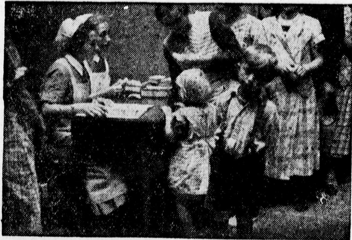
Német népjókeleti intézmény egy brüsszeli menekülttáborban

— A katonák megbecsülésére szólították fel az ír leányokat. Londonból jelentik: Craigavon lord, Észak-Irország miniszterelnöke felszólította az ír leányokat, hogy kegyeiket a katonákkal szemben világosabban mutassák ki. Félelem és visszahúzó-dás a jelenlegi pillanatban nem helyénvaló. A leányoknak nemzeti kötelességük, hogy az egyenruhát széressék, mert ezáltal az önkéntesek áradata növekszik. — mondja Crai-gavon felhívása.