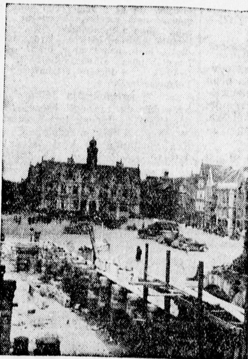
A „Grand Place” Yperben

Nyomatott a Magyar Nemzeti Könyv- és Lapkiadóvállalat Rt. műintézetének kőrforgógépén. Igazgató: Somogyi Gábor.