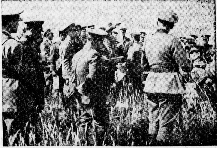
22 állam katonai attaséja megtekintí a francia harteret