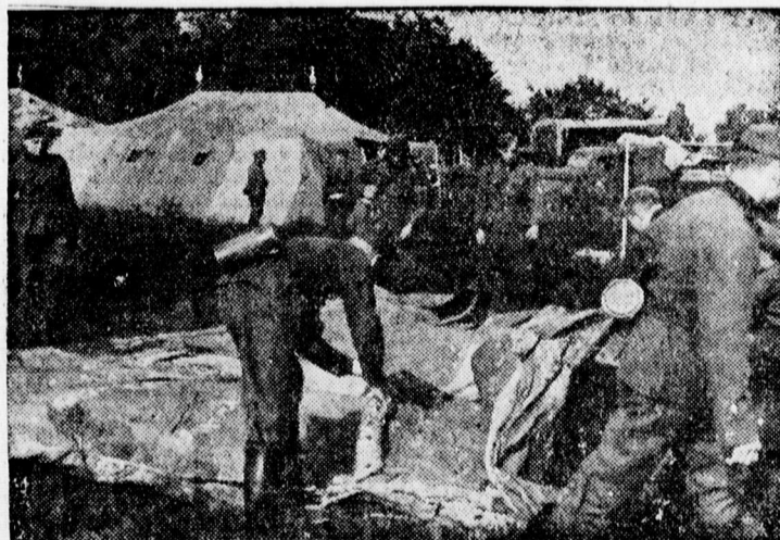
Német SS-vöröskeresztalakulatok sátrat ütnek a kötőzöhelyeken