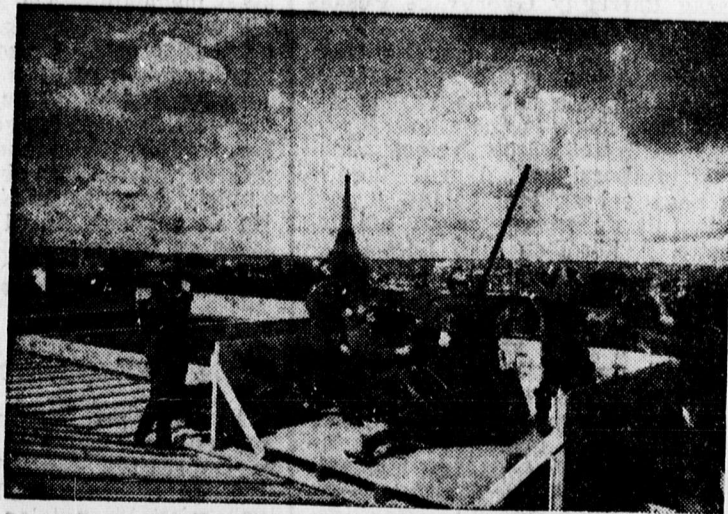
Német légharítóágyú a párisi háztetőkön

— Hamis mérleggel dolgozott egy hosszúpályi hentesüzletben. Az egyik hosszúpályi hentesüzletben a csendőrség az elmúlt nap feljelentés után vizsgálatot folytatott és ennek eredményeként lefoglalta az üzleti mérleget. A vizsgálatnál ugyanis a csendőrség igazolva látta a feljelentést, hogy a mérleg hamis, vagyis a mérésre szolgáló márványlap alá a tulajdonos kis vasdarabot dugott, ami javára billentette a mérleget. A hamis mérleghasználat ügyében tovább folyik a csendőrségi vizsgálat.