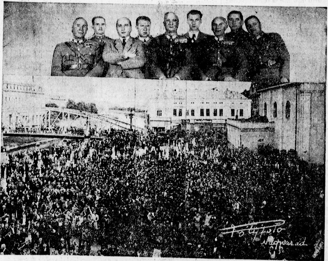
Fent: A magyar tisztküldöttség csoportképe. Alatta: A lelkesedő magyarok tizezrei a városháza előtt

Kolozsváron is felállították már a magyar polgárőrséget és a Székelyföldön megszervezték a székely gárdát. A székely falvak legtöbbször templomtornyain már magyar zász-