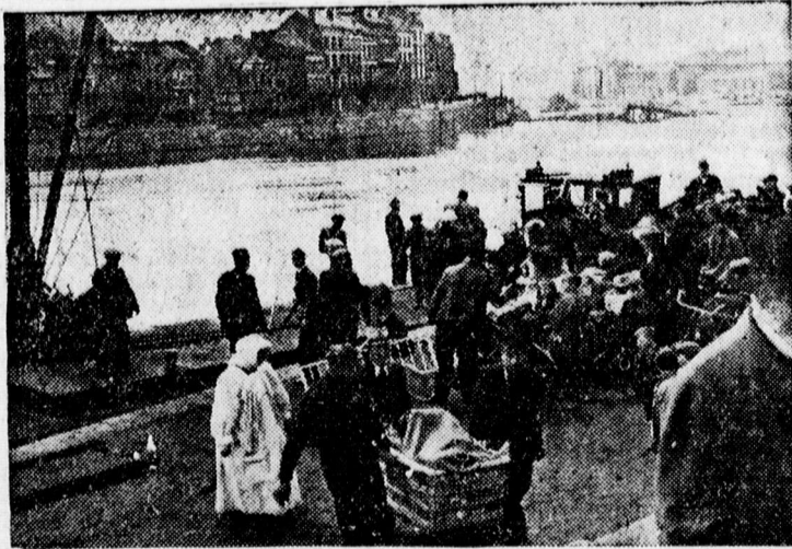
Uszátbhajjokon hazatérő belga menekültek

SOK A BÜNÜGYI FILM a szezon kezdetén Budapesten. Egymásután mutatják