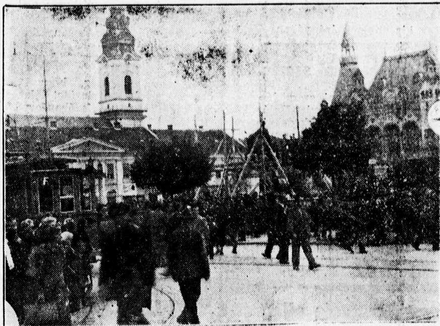
A románok bontják a nagyváradi Ferdinánd-szobrot