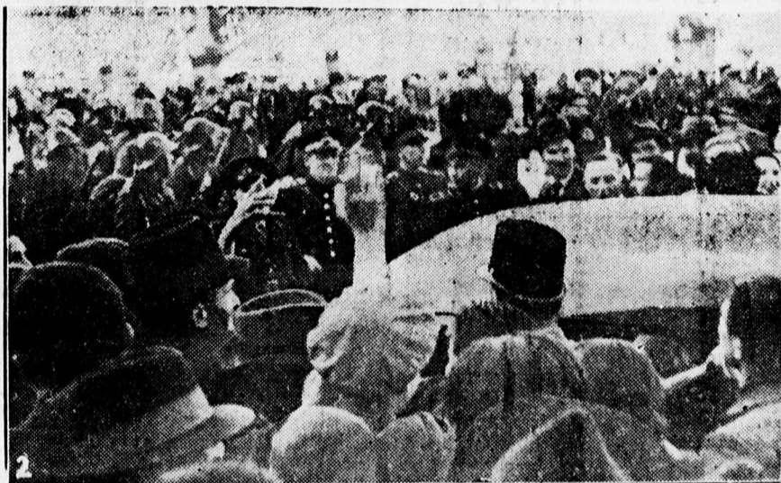
1. A magyar tárgyaló bizottság a nagyváradi városházán 2. Nagyvárad lakossága leírhatatlan lelkesedéssel fogadja a magyar autókat