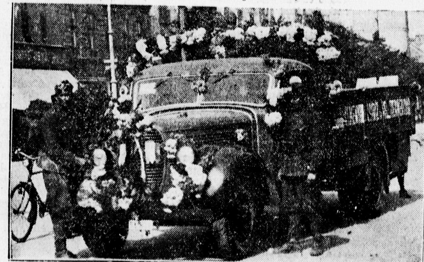
Újon felvirágozott autókkal vonulnak be honvédek Erdélybe.