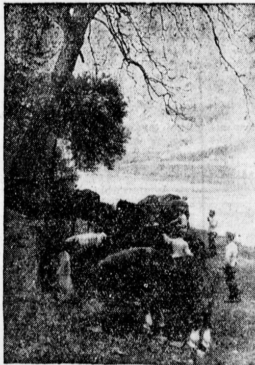
Német katonák gondozzák lovaikat.

Nyomatott a Magyar Nemzeti Könyv- és Lapkiadóvállalat Rt. műintézetének körforgógépén. Igazgató: Somogyi Gábor.