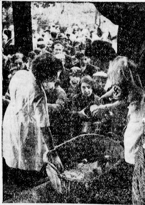
A Bajor gyorssegély különítmény: Német Népiéleti intézmény kenyérkiosztása.

Zöldesszürke raglán férfikabát eladó. Komlóssy-út 15. 657