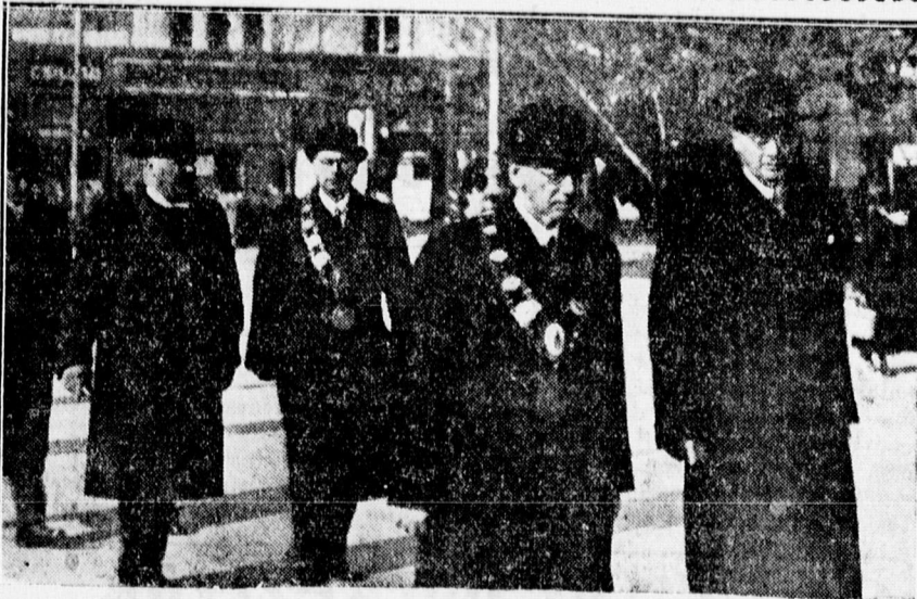
A Tisza István tudományegyetem Tanácsa a fanévnitő istentiszteletre vonul a Nagytemplomba