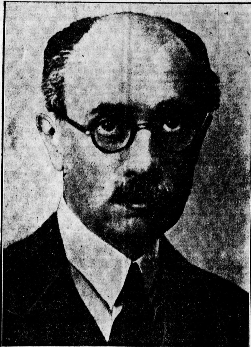
GRÓF TELEKI PÁL

A Telekiek fátumszerű sorstragédiája talán, hogy ő sem érthette meg a magyarságot, vállalt, önfeláldozó munkájának végleges beteljesedését. Az ősi magyar főnemesi Teleki-családban ő a harmadik, aki valóságos nemzetének áldozta életét. Teleki Mihály gróf 1690-ben a kernesti csatában hazájáért küzdve esett el. Teleki László gróf pedig, akit Világos után halálra ítélték és in offiie kivégeztek, 1861-ben nemzete sorsán tépelődve a felirati