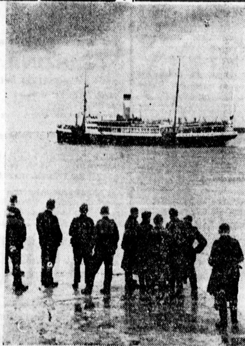
Német katonák a szófiai angol követet elszállító hajót figyelik

Két egymásba nyíló utcai különbejárattal garzon-szoba eljéjtől Honvéd-utca 8. szám alatt kiadó. 1802