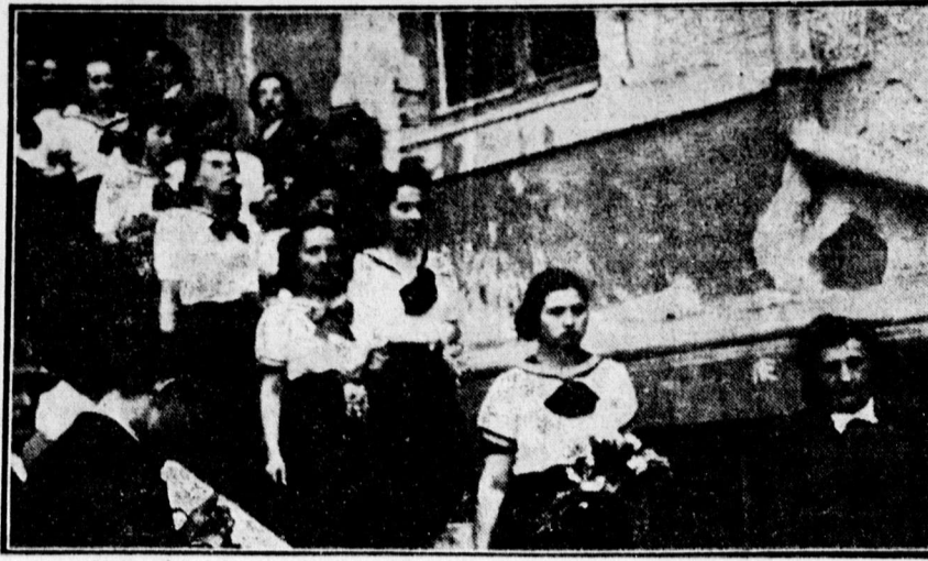
Ballagás a leánykereskedelmién

— Az IBUSZ az idei évben — mint eddig is — újból kiadja a nagyközönség kényelmére balatoni jegyfűzetét: „Egy vidám hét a Balatonon” címmel. Ez a jegyfűzet bármely balatonmelletti fürdőhelyre, vagy Hévízre érvényes az első, vagy utószezonban, tehát május 1-től június 22-ig és augusztus 22-től szeptember 30-ig. A jegyfűzet ára Budapestről, vagy Dunánálról 57 P., a Dunáninnen 59 P és Budapesttől 350 km távolságról túlról 63 pengő.