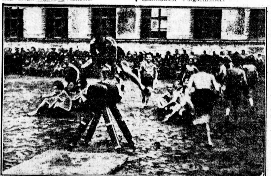
Ref. gimnázium tornavizsgálója

Hirdetmény. Értesítem a belviz és talaviz által megromlott házak tulajdonosait, hogy a falszigeteléshez szükséges csutkahintesű szigetelő lemez f. hó 17-től napi áron nevezetteknek rendelkezésre áll. Az igény bejelentés a városi műszaki ügyosztály 6. sz. szobájában eszközölendő. A szigetelő lemez f. évi július hó 15-ig elszállítandó. Polgármester.