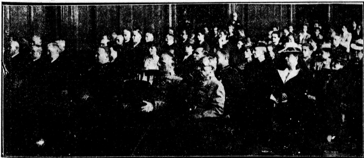
Előkelő közönség az egyetem közgyűlésén