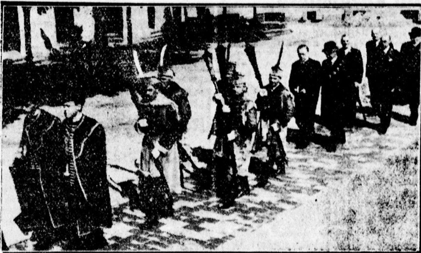
Egyetemi méltóságok tanévzáró Istentiszteletre mennek a Nagytemplomba

lan erkölcsi erőink; nemzeti erőtartalékunk még ma is kimeríthetetlen. Ez azonban nemcsak reménységet nyújt a jövőt illetőleg, de kötelezettségeket is jelent. — Sok hasznos dolog történt a fizikai munkás sorsának enyhítésére, de még itt is újabb bajok forrása buznognak fel. Az is jellemző, hogy amikor a manuális munka bérminimumát a rendelet 15 százalékkal emeli, ugyanakkor csak hettel a szellemi munkás javadalmát. Amilyen végzetes volt a testi munkás erőinek kiszorítása annak idején a nagy tőke által, olyan végzetes lehet a szellemi munkások érdekeinek az elhanyagolása a jövőben.