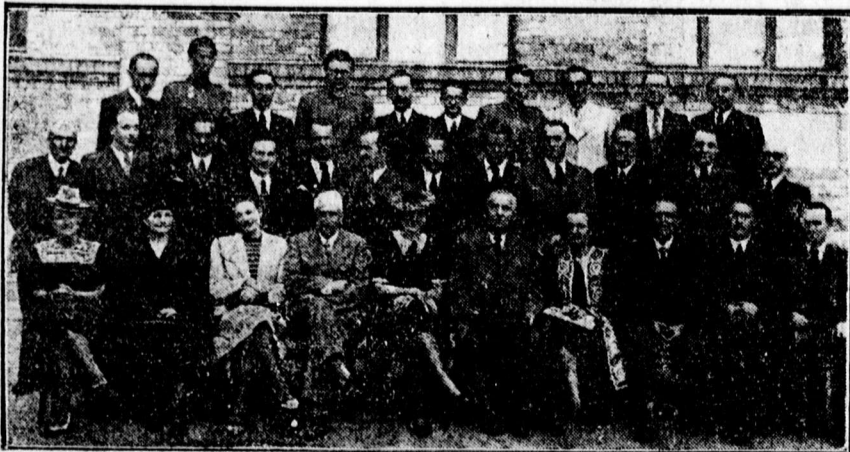
Tíz éves érettségi találkozó a Református Gimnáziumban

— A felszabadult Délvidéken mintegy 40 000 református magyar és körülbelül 15 és fél ezer református német él. Erdélyben még az a megállapított tény, hogy vidéken van az egyetlen horvát református gyülekezet és az egyetlen cseh gyülekezet. Lélekszámuk egyenként feltehetően.