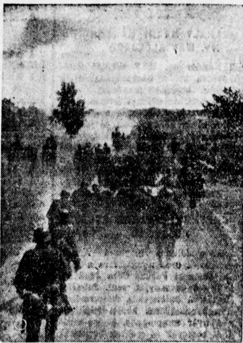
Német gyalogság mélyen Oroszországban

Modern háló, konyha berendezés, hármas kombinált szekrény, rekamié, fotelek, szabó varrógép, rádió, antik komót eladó, Kosuth 51. 385