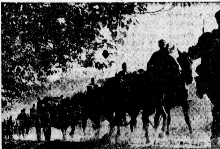
Feltartóztatlanul nyomult előre a német tüzérség

— Nagyarányú razzia a sátorlajuhelyi rendőrség a csendőrséggel, pénzügyőrséggel és közigazgatási hatóságokkal karöltve nagyarányú razzit tartott a város hírhedt gettójában. A razzia során tizenöt külföldi honos zsidót fogtak össze, akik egyáltalán nem tudták igazolni ittartozkodásuk célját. Ezenkívül elkoboztak nagyobb összegű valutát és mintegy húszezer pengő értékű elrejtett bórart, lisztet, szappant, textilanyagot, rézgálicot és cukrot. A be nem jelentett árut és idegen honos fajtestvéreiket rejtegető zsidó családok ellen szigorú eljárást indítottak a hatóságok.