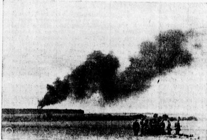
Egy orosz benzintartály megsemmisítése