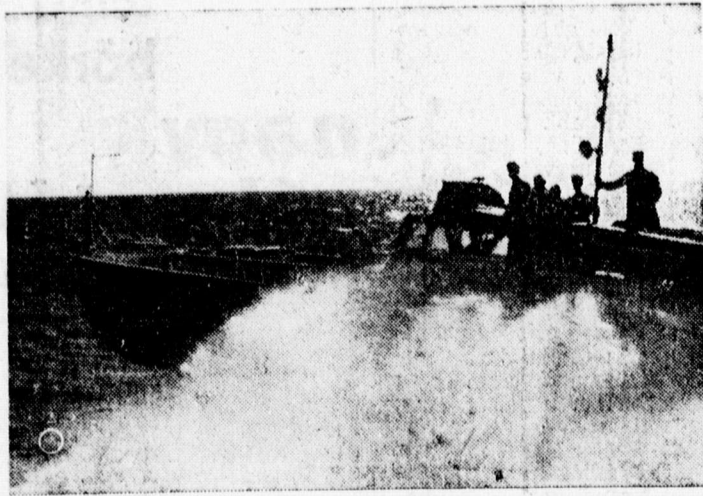
Olasz gyorsnaszád ellenséges ártan.

— Kifogták az elszórt uszodát. A közelmúltban átvonult vihar idején a megduzzadt Körös magával sodorta Nagyváradon a régi Pankolics-uszodát. A folyó hullámain táncoltak a napozó padok, tutajok, lépcsők és felágaskodó gerendák integettek. A város vezetősége elhatározta, hogy „kifogdossa” az elszórt fűrőd roncseit. Ezt meg előzően azonban az történt, hogy Biharzentandráson a község lakossága, mint váratlan ajándékot hallásztta ki a vízből a faalkotmány darabjait és jobb híjján feltűzte. Ezt megtudták a váradiak és mint tulajdonosok feljelentést tettek a csendőrségen a biharzentandrásiak ellen. A feljelentést most áttették a váradi ügyészségre.