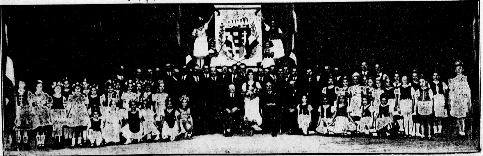
A Biztosító Intézetek matinéjának szereplői a Csokonai-színházban