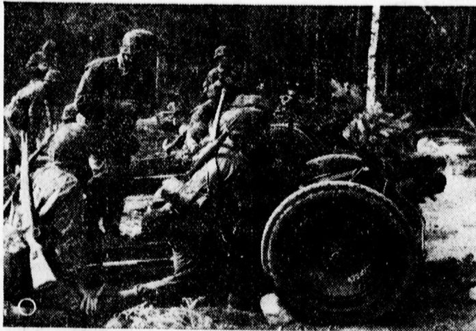
Német fegyveres SS egy ellenséges erőre tüzel.

— Iparigazolvány nélkül dolgozott Szatmáron a zsidó kalapkirály — rajtakapták. A szatmári iparhatóság ellenőrző útja közepette most rántotta le a leplet Fögel Salamon szatmári lakosról, aki lakásában minden engedély nélkül kalapgyártást rendezett be. Fögel Salamon, a kalapkirály javában folytatta a kalapgyártást több segédmunkással, mikor rajta kapták. A közigazgatási rendőrbírója iparigazolvány nélküli iparüzését Fögel Salomont 200 pengő pénzbüntetésre ítélte, vagy ennek behajthatatlansága esetén negyvennapos elzárásra.