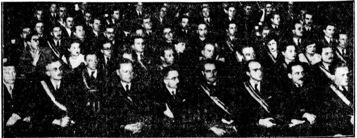
A követtábor résztvevői