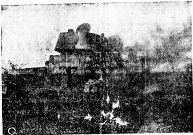
Egő orosz páncélos