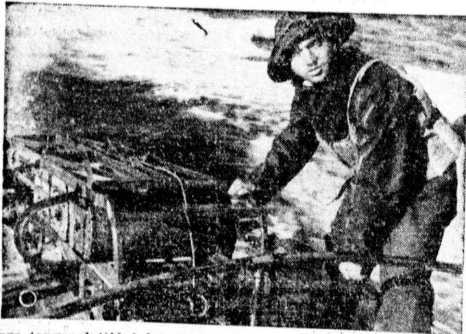
Egy olasz tengeralattjáró lehallgató készülék vizreboosítása

— A Kolozsvári EAC jéghoki csapata szombaton reggel érkezik Debrecenbe és a DEAC jéghoki csapata ellen szombaton vasárnap mérkőzést játszik. Az 1941. évi főiskolai jéghoki bajnokság első és harmadik helyezettje közötti mérkőzés érdekesség igérik. A KEAC és a DEAC Erdőy visszavágására óra most veszik fel egymás között első ízben a sport érintkezést, a régi kapcsolatok felújításának örömeire a két csapat a mérkőzés kezdete előtt emléksztetőt nyújt át egymásnak. A mérkőzés szombaton délután fél 4 és vasárnap délelőtt fél 12 órakor kezdődik a nagyterdei stadionban.