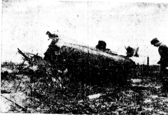
Leült angol repülőgép

— II. félévi beiratkozások a Zeneiskolában. Debrecen sz. kir. városi Zeneiskolájában a II. félévi beiratkozások folynak. Beiratkozni lehet az összes fő- és mellékintézményekre. Tandíjak: 8, 10, 12, 14 P. Zenei előkészítő (ovoda) 3 P. Fúvósintézmény 2 P. az összes mellékintézményeken 5 P havonta. Nagybőgő-tanulmány ingyen. Beiratási díj: 6 P. Bővebb felvilágosítás nyerhető a Zeneiskola titkári hivatalában naponta délelőtt 9—11-ig és délután 3—6-ig. Telefon: 23-96. Vár-u. 1. sz.