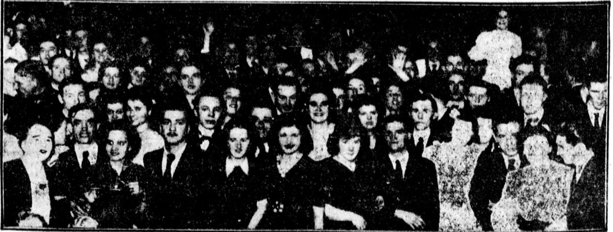
A táncestély rendezése az Arany Bika-szállóban