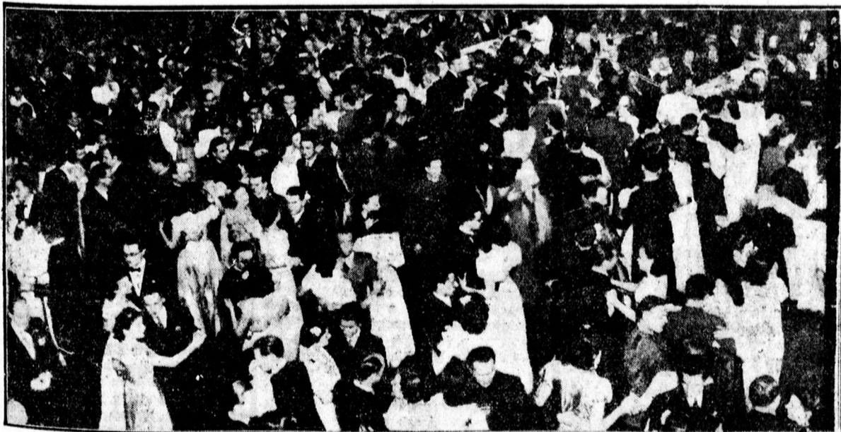
Az Ev. Filéregylet toaestjének táncoló ifjúsága az Arany Bika disztermében

nyugati partján. A harc tovább tart. Az OFI francia hírgyűnkés hivatals jelenést közöl arról, hogy a Szingapurban partraszállt első japán hullám után a tüzérségi fedezet alatt nyomban harcokosik keltek át a esatornán és az élénk ellenséges tűz ellenére megtisztogatják az elhódított területet. A esászari főhadiszállás hétfőn este közölte, hogy megindították Szingapur ellen a végső támadást. Róma, február 9. (MTI) A déli olasz lapok vastagbetűs címek alatt jelentik, hogy a japán csapatok partraszálltak Szingapur szigetén. A Piccolo távolkeleti szolgálata a következő jelentésben számol be a partraszállásról: A japánok a johorei esatorna legkeskenyebb pontján keltek át, ahol