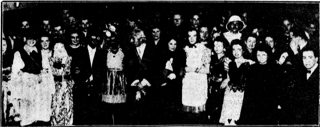
Levegőes-est a Vitezi Székházban.

Írógép tökéletes javítása, újjáépítése. HURAY okl. írógép-műszerész m.