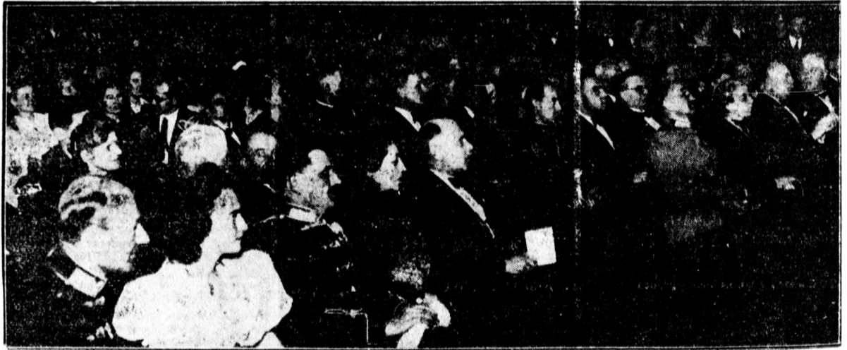
Katonai és polgári előkelőségek az Iparosok műsoros estjén